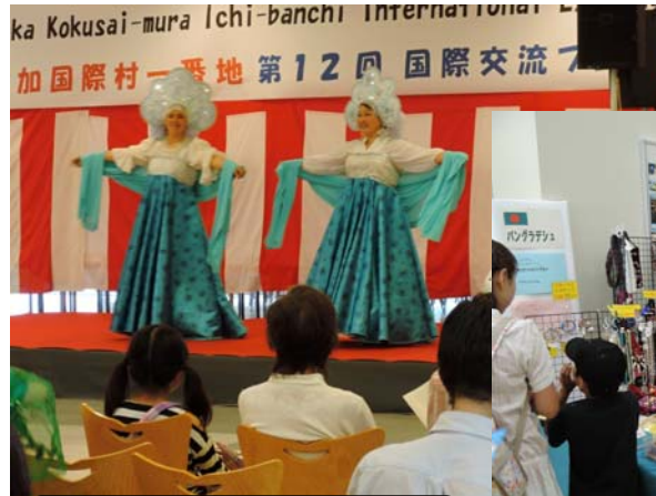
↑ ロシアの親子会 KALINKA のダンス

平成28年度の国際交流フェスティバルは、6月12日(日)開催予定で実行委員会が開かれ、準備をすすめています。