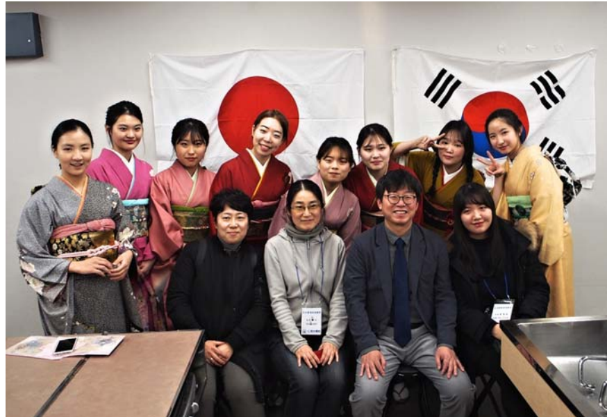
左上 食事を楽しみながら懇談 上 振り袖で記念撮影 左下 草加市役所での韓国物産即売会(2月17日午後)