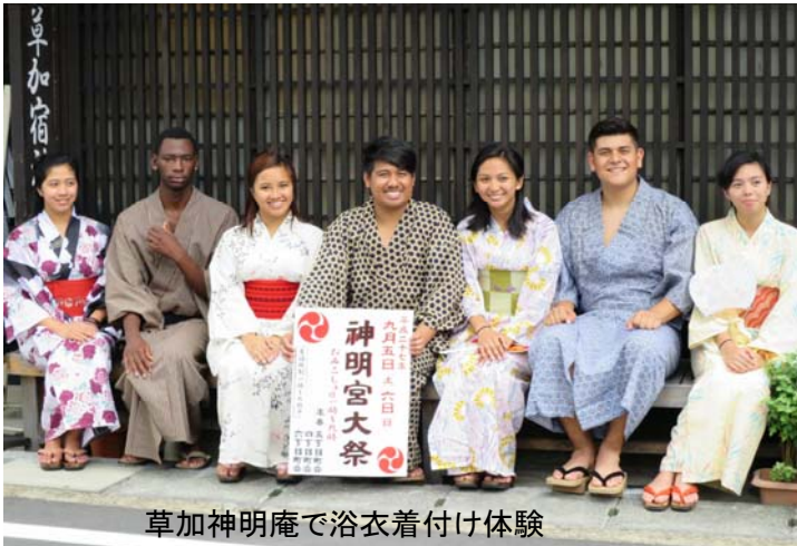
草加神明庵で浴衣着付け体験