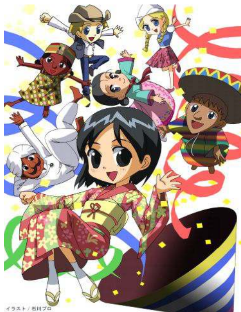
イラスト/石川プロ