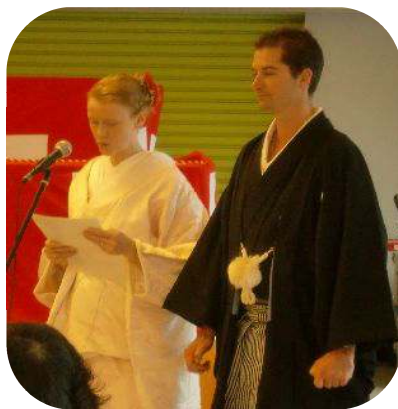
しろむく・もんつきはかますがた しかい 白無垢・紋付袴姿で司会！