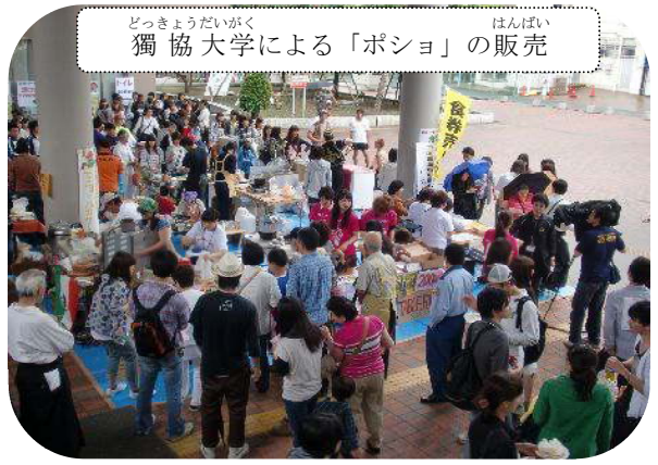
どつきょうだいがく ほんばい 獨協大学による「ポシヨ」の販売