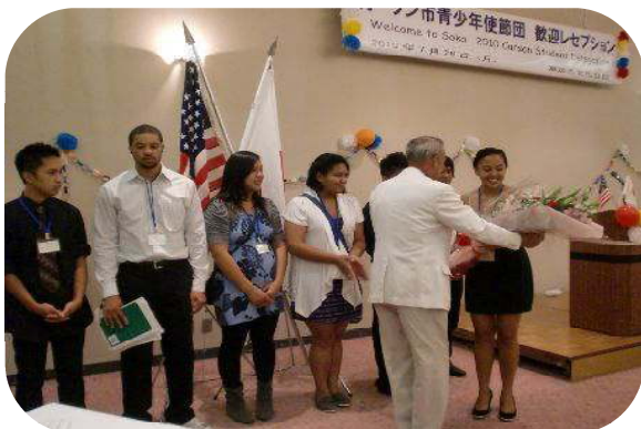
7月26日(月) 表敬訪問(右)・歓迎レセプション(左)