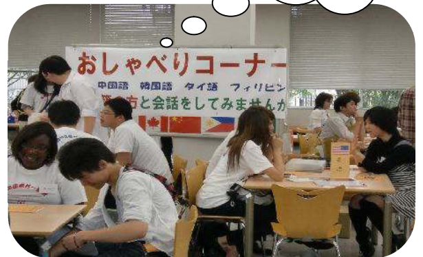
おしゃべりコーナー 中国語 韓国語 タイ語 フィリピン語 など会話してみませんか