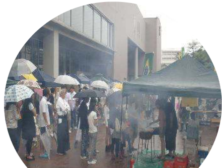
あめ にかか だいせいきやう 雨にも関わらず大盛況！