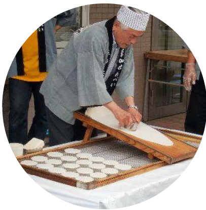
そうかして ほぞんかい 草加市手のし保存会