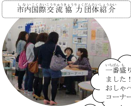
しんないこくさいこうりゅうきょうりやくだんたいしやうかい 市内国際交流協力団体紹介