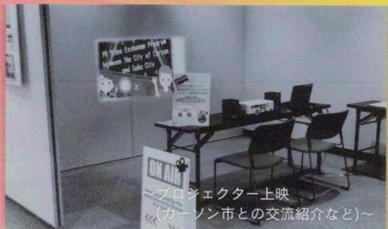
～プロジェクター上映 (カーソン市との交流紹介など)～