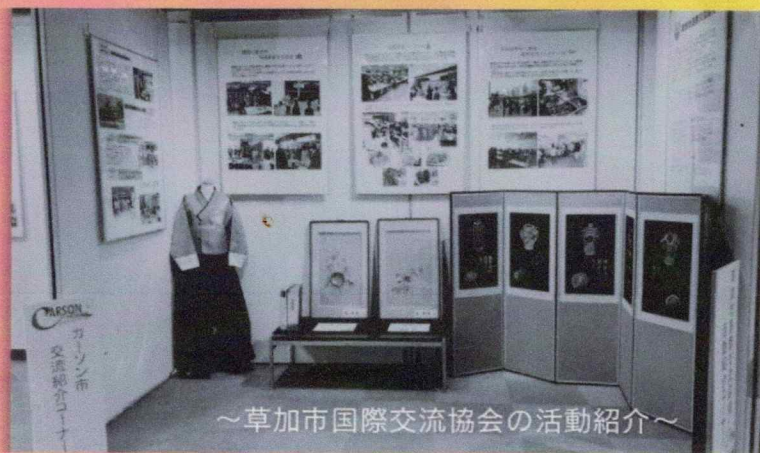
～草加市国際交流協会の活動紹介～