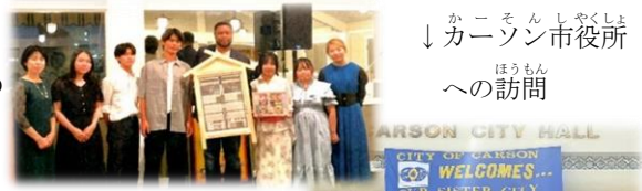
カーソン市役所 への訪問

今後は、帰国後の報告活動として「カーソン紀行」の発行や、1月19日開催の「国際交流パーティー」にて団員からの報告発表を行います。その他、「あゆみ展示会」でも記念品等を展示予定です。会員の皆さまも是非ご覧ください。