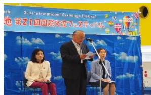
草加市国際交流協会 蓮沼会長