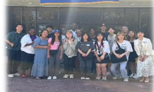
さよならパーティー にて